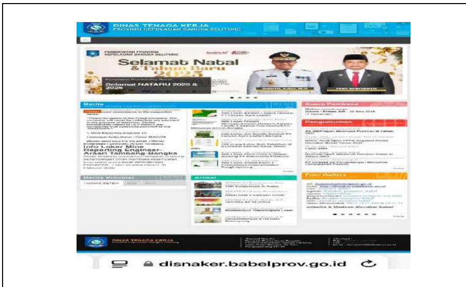
Gambar II.2. Dinas Tenaga Kerja Provinsi Kepulauan Bangka Belitung

Tenaga Kerja Provinsi Kepulauan Bangka Belitung. Ada juga menu untuk pengaduan, pelayanan masyarakat, dan prosedur pelayanan masyarakat yang dilakukan di Dinas Tenaga Kerja Provinsi Kepulauan Bangka Belitung, seperti berita dan informasi, pelayanan data dan PPID.